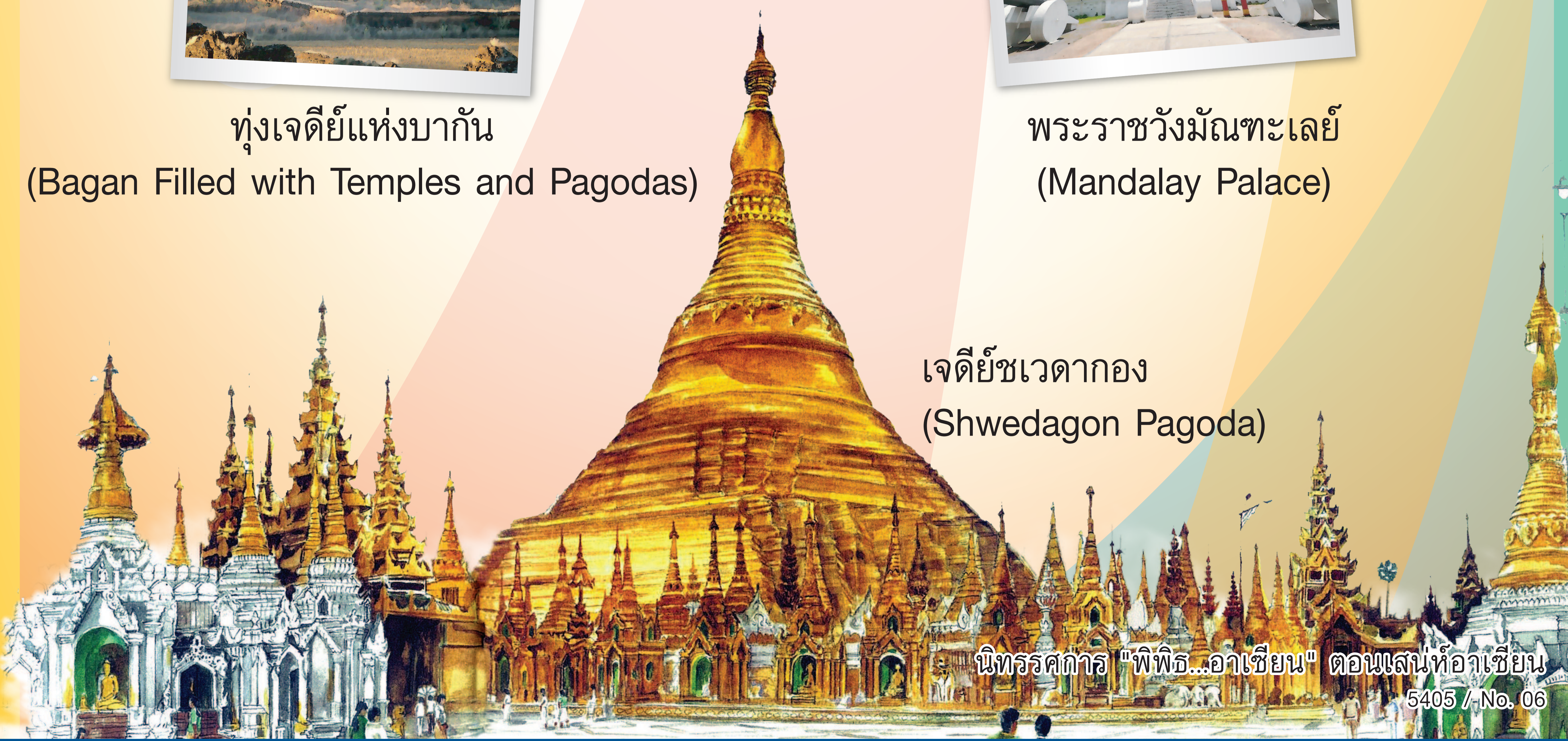
เจดีย์ชเวดากอง (Shwedagon Pagoda)

นิทรรศการ "พีพีอี...อาเซียน" ตอนเล่นที่อาเซียน 5405 / No. 06