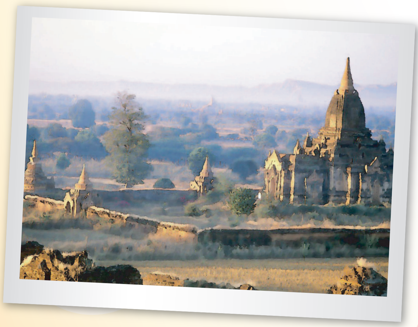
ทุ่งเจดีย์แห่งบากัน (Bagan Filled with Temples and Pagodas)