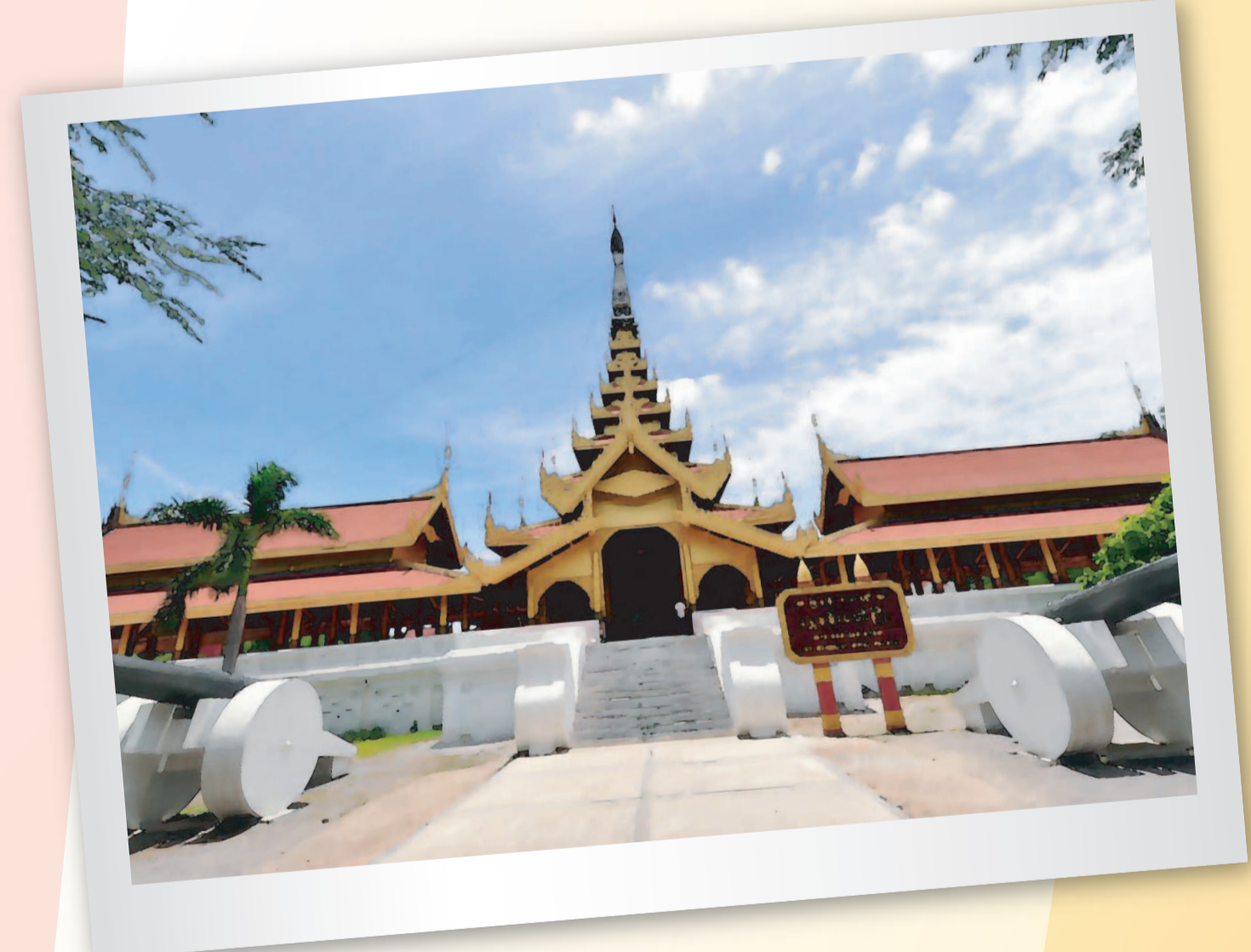
พระราชวังมัณฑะเลย์ (Mandalay Palace)